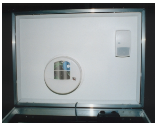
Locket på väskan symboliserar ett tak med rörelsedetektor och brandvarnare.